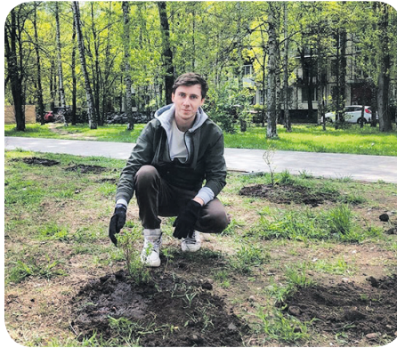
Посадка саженцев кустарников (сквер ул. Стойкости д. 9-11)

Это проблема для всех муниципалитетов, где массовая застройка домов произошла в 70-е годы. Наши дворы не рассчитаны на большие парковочные пространства, и мы понимаем - даже если снести все детские площадки и скверы, мест для парковки всем жителям всё равно не хватит. Где возможно сделать уширение проездов, это было