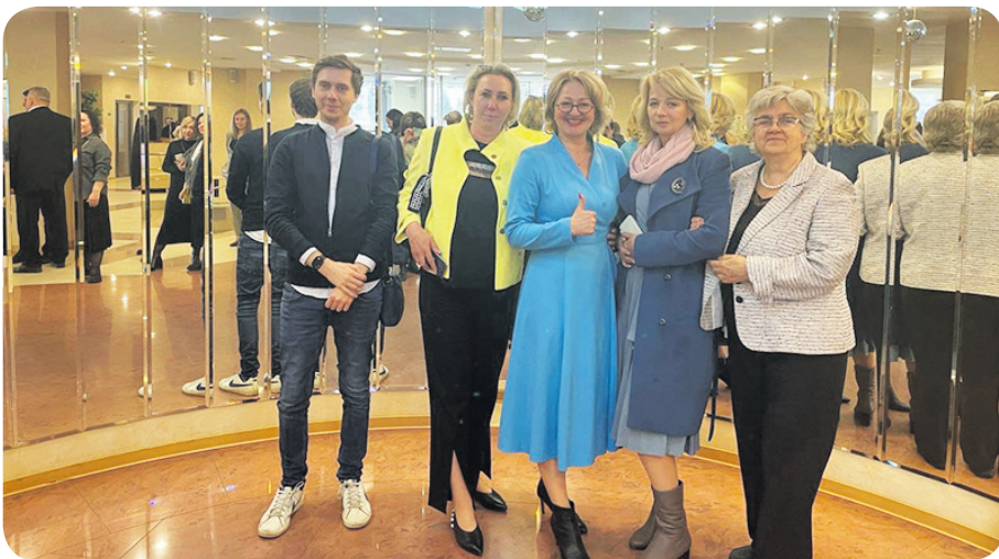
25 лет органам ОМСУ

- Большая проблема для всех муниципальных образований сегодня - это вандализм на детских площадках. Как боретесь с ней?