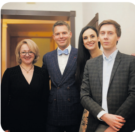
Закулисье концерта «Дыхание весны»

Со стороны муниципалитета отправляют запросы на установку видеорекамера по программе, но без помощи жителей в этом вопросе не обойтись. Поэтому, если вы видите, как подростки рисуют граффити на игровом оборудовании, сделайте им замечание или позвоните в полицию. Поговорите со своими детьми и внуками о правилах культуры и поведения. Ежегодно сотни тысяч рублей уходят на ремонт и восстановление испорченного оборудования, а это могли бы быть новые зоны отдыха, асфальтовое покрытие и игровая зона.